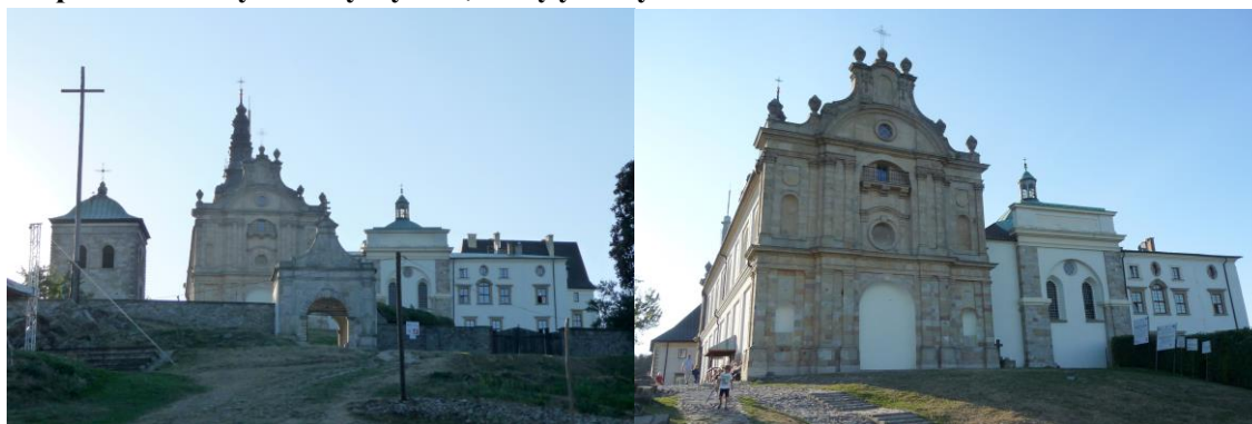
Zdjęcia nr 3, 4. Zespół klasztorny, Święty Krzyż

Zespół klasztorny benedyktynów obejmujący kościół pw. Trójcy Św., klasztor, dzwonnica, ogrodzenie z bramą i bramę wsch. oraz dawny szpital, położony jest nieco poniżej szczytu Łysej Góry, w kierunku płn.-wsch. Usytuowany w otwartej przestrzeni, dominuje nad okolicą, dookoła – puszcza jodłowa. Wzgórze opada stromym zboczem wsch. do Nowej Słupi, po którym wiedzie Droga Królewska, w górnej części wyłożona kamieniem. Ruch kołowy prowadzi od zach. Teren zespołu wrzecionowaty, wydłużony na linii wsch.-zach., częściowo naturalny, częściowo splantowany, otoczony jest murami oporowymi i ogrodzeniem z bramami. Zespół składa się z orientowanego kościoła – stanowiącego płd. zamknięcie prostokątnego wirydarza klasztornego i klasztoru – razem tworzących zamknięty czworobok zabudowań z krużgankami obiegającymi wirydarz; od zach. dwa skrzydła na rzucie litery L, które otaczają dziedziniec otwarty na płd. Na osi płn. skrzydła klasztoru – tzw. wielki ryzalit; między nim a bramą główną – obszerny plac gospodarczy otoczony wysokim, kamiennym murem. W płn.-zach. części założenia – budynek dawnego szpitala, przed nim rozległy, owalny plac – dawny dziedziniec więzienny. Obszar założenia określają mury oporowe, ogrodzenia i bramy. Brama główna – w części wsch. Między bramą a kościołem – dzwonnica. Elementem współczesnym jest tu wieża przekaźnika radiowo-telewizyjnego o wysokości 157 m, wzniesiona w 1966 r., zlokalizowana w odległości ok. 100 m od zespołu.