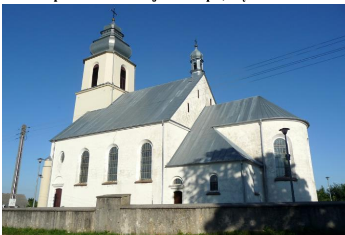
Zdjęcie nr 2. Kościół pw. Św. Mikołaja Biskupa, Dębno