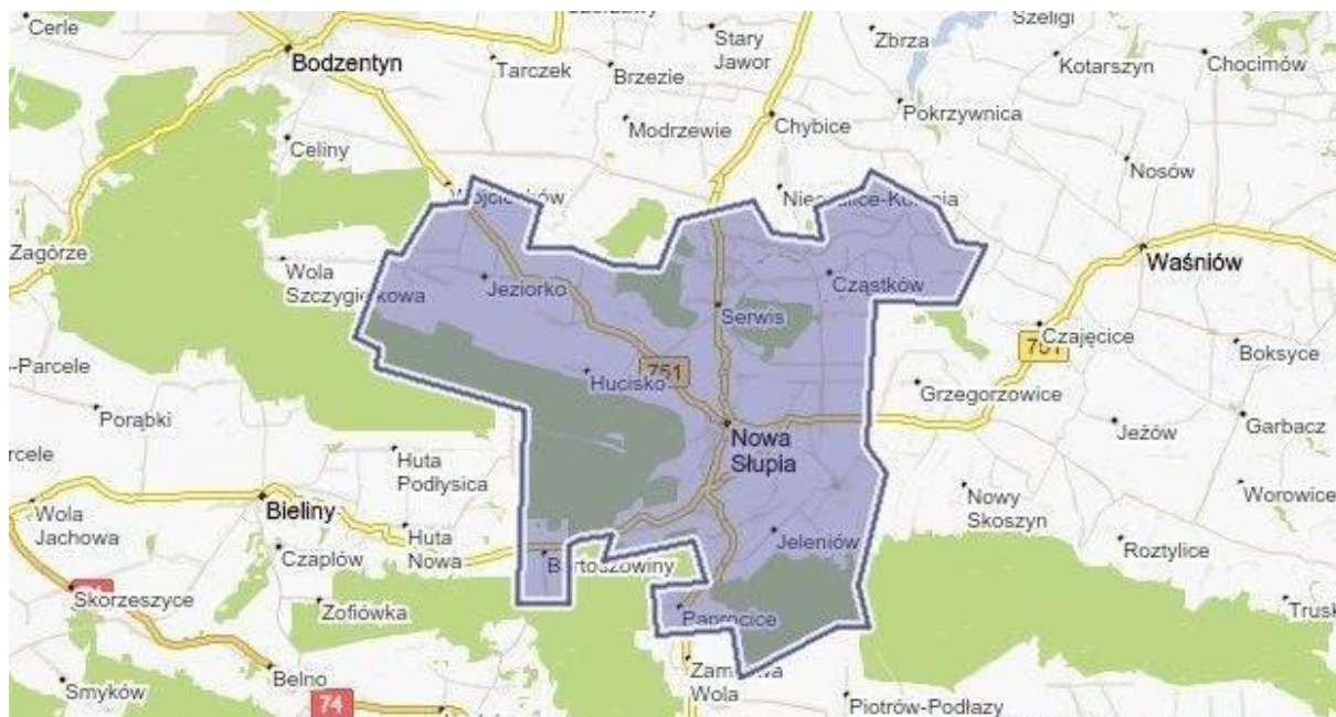
Obrazek nr 1 Położenie Gminy Nowa Słupia