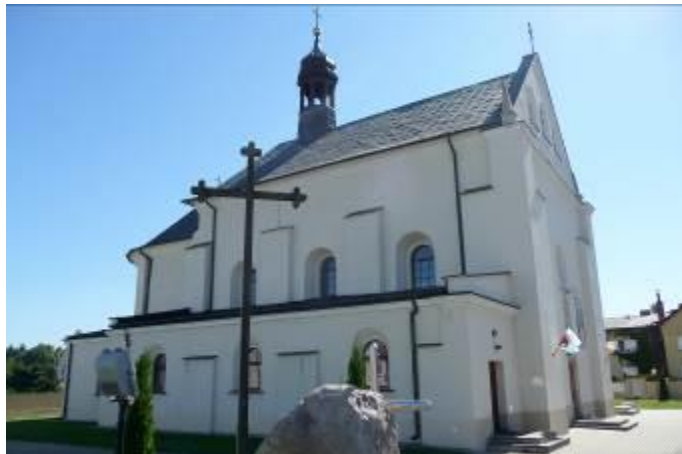
Zdjęcie nr 1. Kościół parafialny pw. św. Wawrzyńca w Nowej Słupi