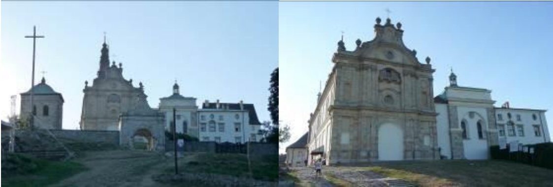
Zdjęcia nr 3, 4. Zespół klasztorny, Święty Krzyż

Zespół klasztorny benedyktynów obejmujący kościół pw. Trójcy Św., klasztor, dzwonnice, ogrodzenie z bramą i bramę wsch. oraz dawny szpital, położony jest nieco poniżej szczytu Łysej Góry, w kierunku płn.-wsch. Usytuowany w otwartej przestrzeni, dominuje nad okolicą, dookoła – puszcza jodłowa. Wzgórze opada stromym zboczem wsch. do Nowej Słupi, po którym wiedzie Droga Królewska, w górnej części wyłożona kamieniem. Ruch kołowy prowadzi od zach. Teren zespołu wrzecionowaty, wydłużony na linii wsch.-zach., częściowo naturalny, częściowo splantowany, otoczony jest murami oporowymi i ogrodzeniem z bramami. Zespół składa się z orientowanego kościoła – stanowiącego pld. zamknięcie prostokątnego wirydarza klasztornego i klasztoru – razem tworzących zamknięty czworobok zabudowań z krużgankami obiegającymi wirydarz; od zach. dwa skrzydła na rzucie litery L, które otaczają dziedziniec otwarty na pld. Na osi płn. skrzydła klasztoru – tzw. wielki ryzalit; między nim a bramą główną – obszerny plac gospodarczy otoczony wysokim, kamiennym murem. W płn.-zach. części założenia – budynek dawnego szpitala, przed nim rozległy, owalny plac – dawny dziedziniec więzienny. Obszar założenia określają mury oporowe, ogrodzenia i bramy. Brama główna – w części wsch. Między bramą a kościołem – dzwonnica. Elementem współczesnym jest tu wieża przekaźnika radiowo-telewizyjnego o wysokości 157 m, wzniesiona w 1966 r., zlokalizowana w odległości ok. 100 m od zespołu.