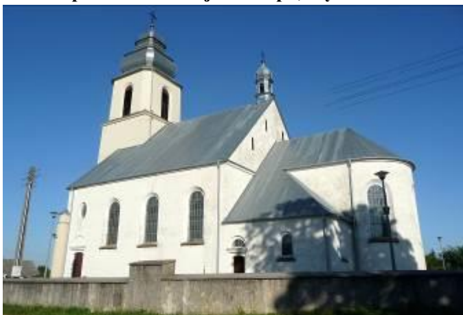
Zdjęcie nr 2. Kościół pw. Św. Mikołaja Biskupa, Dębno

Kościół wzniesiony został w 1936 r. na miejscu lokalizacji starszego kościoła. Na rzucie prostokąta z węższym, zamkniętym półkoliście prezbiterium ujętym parą prostokątnych aneksów i z pięciokondygnacyjną wieżą w fasadzie, częściowo wpuszczoną w mury korpusu. W narożach fasady – niskie cylindryczne wieżyczki, w szczycie dachu nawy - sygnaturka. Ściany murowane, tynkowane, dach kryty blachą.